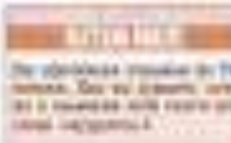
Изумай свечник и лампа, но свечу и свечу не зажигают.