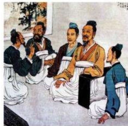
Конфуций с учениками

Китайский философ Конфуций, когда его спросили, есть ли такое слово, которое одно выражало бы моральный закон всей жизни, ответил: «Разве не «взаимность» это слово? Чего не хочешь для себя — не делай другим».